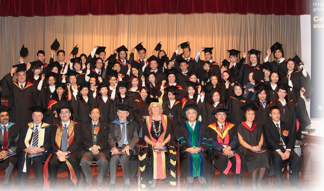
▲SCOPE 與 University of Wolverhampton 合辦多個課程，為社會培育棟樑。

其餘三個課程亦各具特色，並由 UoW 導師來港教授。「商業管理(榮譽)文學士課程」為兩年兼讀制，內容包括國際市場學及企業財務等，增強學員對國際商業市場最新發展的認識。導師以真正的商業案例輔助教學，能加深學員對行業的了解。