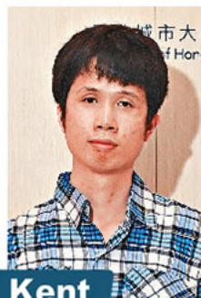
Kent 創意數碼媒體設計及製作助理證書畢業生

他不諱言，資訊科技人才需要具備「3T」才可以應對行業的急速發展，除了科技(Technology)，其餘就是可轉移能力(Transferable)及有改造能力(Transformative)。「前者是指，人才能將所學的知識和技術轉移應用在不同領域上，以多媒體為例，受眾或市場不再滿足於一段文字、一張圖片，而是要不同的媒介配合，提高提供者及受眾的互動性；後者則是指人才需要持續進修，不斷觀察及吸收新資訊，以固有知識和技術配合市場需求。」