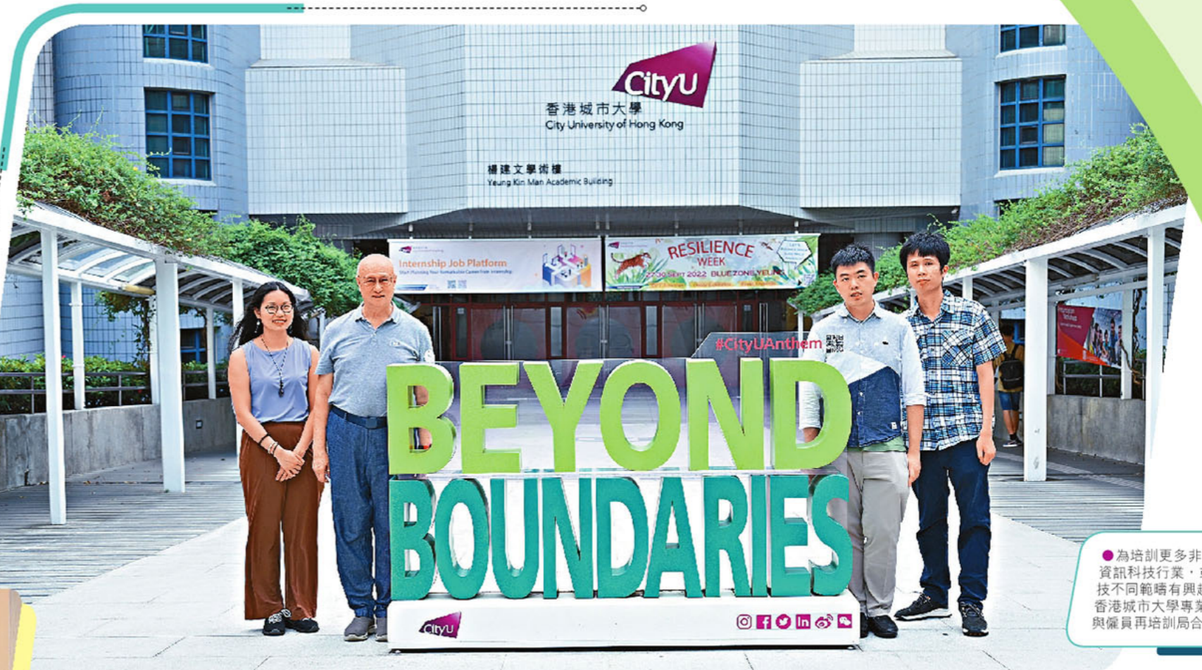
●為培訓更多非IT人士轉職資訊科技行業，或對資訊科技不同範疇有興趣的人士，香港城市大學專業進修學院與僱員再培訓局合辦課程。

人力資源顧問公司萬寶盛華於9月公布今年第四季「就業展望調查」，資訊科技及通訊媒體業的就業展望指數為百分之五十七，按年上升五十七個百分點。這與企業銳意加強數碼轉型，包括針對企業的網絡攻擊日漸增多，以及第三代互聯網(Web 3.0)概念衍生對人工智能、區塊鏈與有開發人才的需求有關。