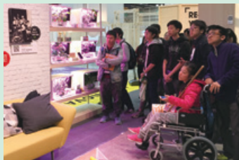
參觀創意設計展覽