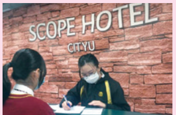
酒店入住登記模擬練習