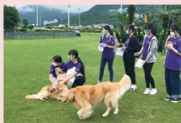
觀察犬隻行為活動－彭福公園