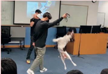
工作犬訓練分享會