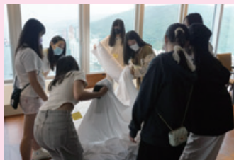
房務服務技巧練習