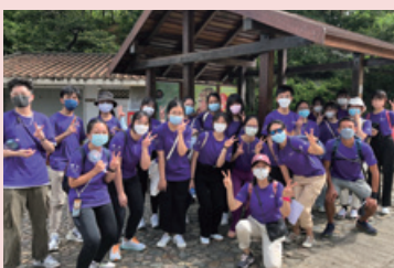
認識香港動物－金山