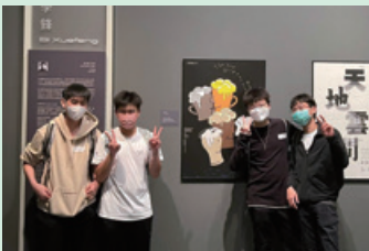
參觀香港文化博物館「敦煌」