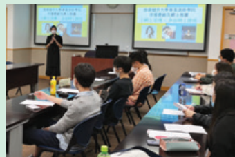
認識O2O市場營銷推廣講座