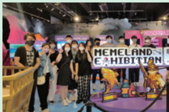
參觀數碼互動遊樂園 「Memeland」