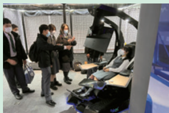
參觀香港生產力促進局