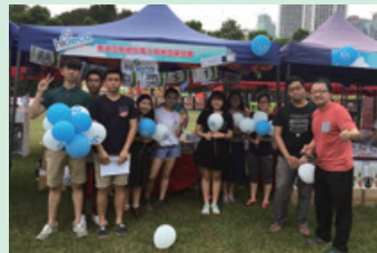
外出參觀及考察活動