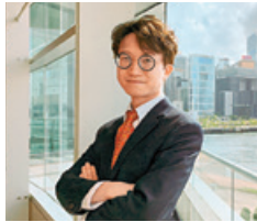
Wardrobe: Loa Hai Shing/ Hair styling: Joseph Lui (HAIR)/ Make up: Alan Poon

Insensitivity, ignorance, or arrogance may contribute to biased language, and public relations professionals are not expected to shrug off their responsibility for their language.