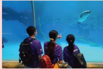
海洋公園水族館工作坊